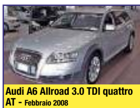
Audi A6 Allroad 3.0 TDI quattro AT - Febbraio 2008