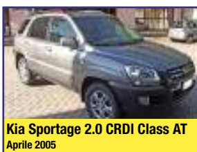
Kia Sportage 2.0 CRDI Class AT Aprile 2005