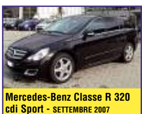
Mercedes-Benz Classe R 320 cdi Sport - SETTEMBRE 2007