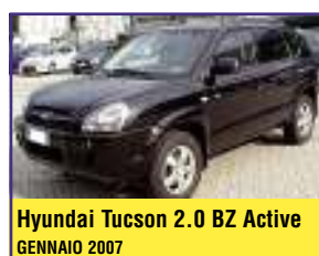
Hyundai Tucson 2.0 BZ Active GENNAIO 2007