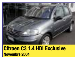
Citroen C3 1.4 HDI Exclusive Novembre 2004