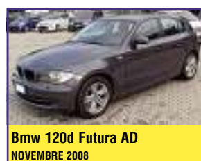
Bmw 120d Futura AD NOVEMBRE 2008