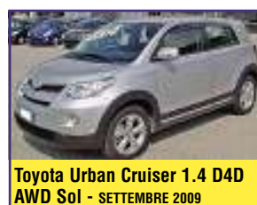
Toyota Urban Cruiser 1.4 D4D AWD Sol - SETTEMBRE 2009