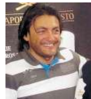
a pagina 31