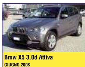
Bmw X5 3.0d Attiva GIUGNO 2008