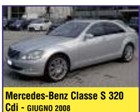
Mercedes-Benz Classe S 320 Cdi - GIUGNO 2008