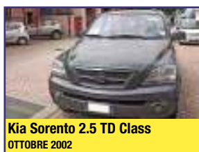
Kia Sorento 2.5 TD Class OTTOBRE 2002