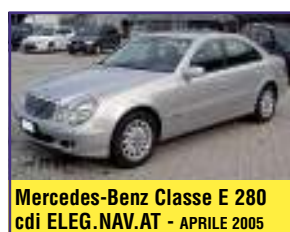
Mercedes-Benz Classe E 280 cdi ELEG. NAV. AT - APRILE 2005