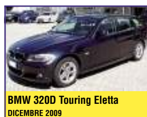
BMW 320D Touring Eletta DICEMBRE 2009