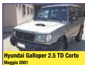
Hyundai Galloper 2.5 TD Corto Maggio 2001