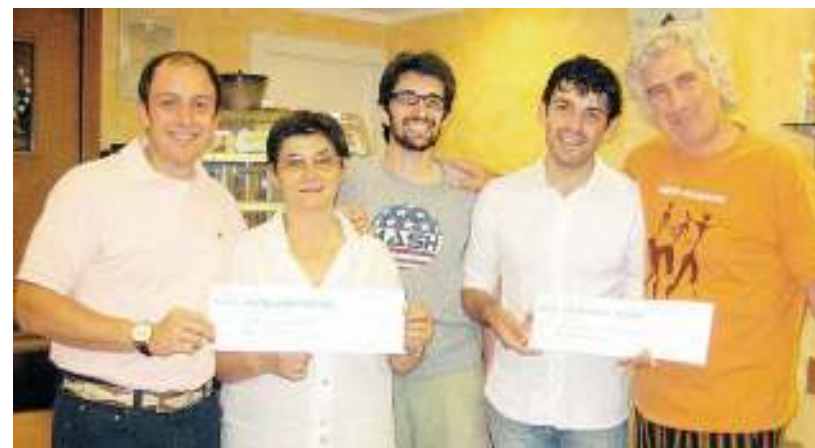
SOLIDARIETA' La consegna dei fondi raccolti durante la manifestazione di giugno

Tanto che, oltre all'appuntamento autunnale, è ormai certo che «Valtellina: Sport, Solidarietà, Sapori» farà il bis il prossimo anno.