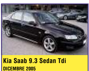
Kia Saab 9.3 Sedan Tdi DICEMBRE 2005