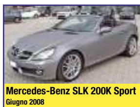
Mercedes-Benz SLK 200K Sport Giugno 2008