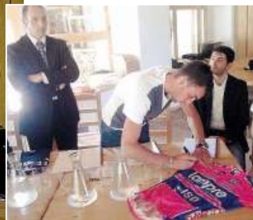
PRESENTAZIONE Nelle foto alcuni momenti della presentazione del grande evento «Valtellina sport, solidarietà e sapori».