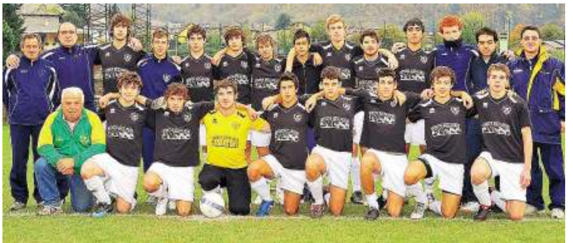
La formazione Juniores della Talamonese

Talamonese che conferma la proverbiale bontà del suo vivaio con la presenza in campo regionale lo scorso anno addirittura di ben tre formazioni, in collaborazione anche con il Morbegno 1908 con cui allestisce da questa stagione la scuola calcio.