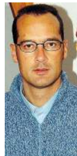
Il sindaco Pedrini

VALDISOTTO (cvb) L'ambulatorio medico di Cepina in Valdisotto rimarrà chiuso per due mesi, fino al 10 settembre. Gli utenti del servizio saranno costretti a recarsi negli studi medici di Bormio, Sondalo e Valfurva. L'interdizione del servizio è dovuta ai lavori di riqualificazione energetica e ambientale, igienico-sanitaria e di consolidamento sismico dell'edificio pubblico.