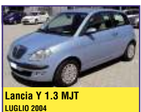
Lancia Y 1.3 MJT LUGLIO 2004