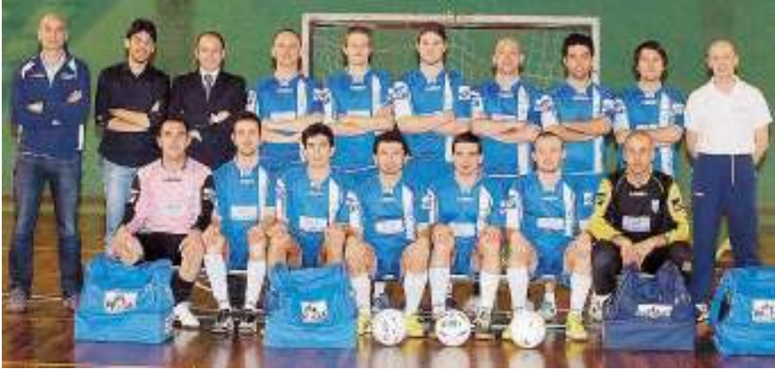
La dirigenza e la squadra al completo del Valtellina Futsal