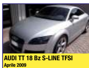
Audi TT 18 Bz S-LINE TFSI Aprile 2009