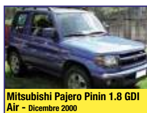
Mitsubishi Pajero Pinin 1.8 GDI Air - Dicembre 2000