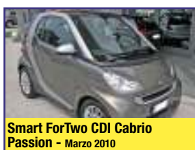
Smart ForTwo CDI Cabrio Passion - Marzo 2010